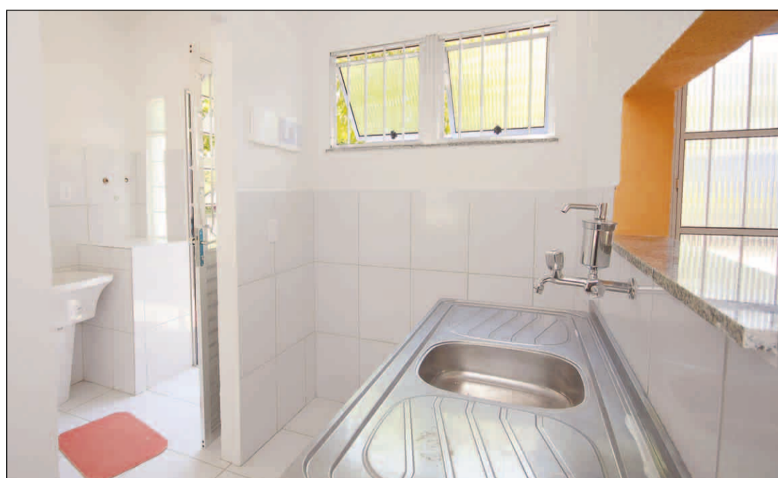
COZINHA é pequena, mas tem espaço para fogão, geladeira e armário. E tem abertura para a sala