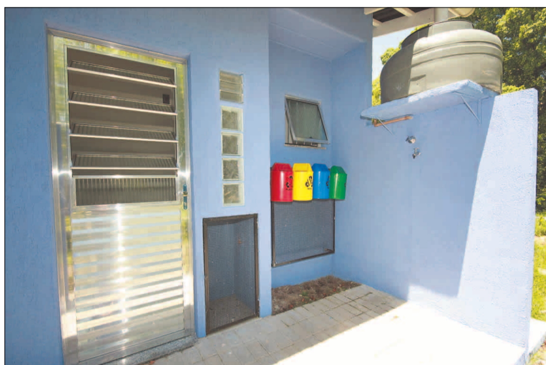
LIXEIRA de material reciclável fica do lado de fora da lavanderia, que é integrada ao imóvel

O REPÓRTER VIAJOU PARA O RIO DE JANEIRO A CONVITE DA EMPRESA HOLCIM.