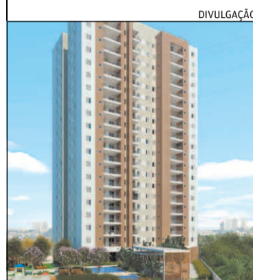
ENTREGA prevista para 2011

► A cidade de São Paulo iniciou o ano com 1.231 ações judiciais relativas a contratos de locação, de acordo com Sindicato da Habitação (Secovi-SP). É o menor volume em um mês de janeiro desde 1994, quando foram registradas 1.127 ações. A quantidade de ocorrências de janeiro foi 4,1% inferior à de dezembro de 2009 (1.283) e 19,1% menor do que o verificado em janeiro do ano passado (1.522 casos). A Penha foi o bairro que registrou a maior queda entre as regionais, com baixa de 41,5% em relação ao mesmo período de 2009.