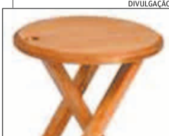
O BANCO terá cinco cores

► Vinte e cinco anos depois do lançamento, a Butzke coloca no mercado, com novas cores, o Bankotte. Pequeno e dobrável conserva uma de suas principais qualidades: a versatilidade. Em cinco cores diferentes, parte de R$ 75,10.