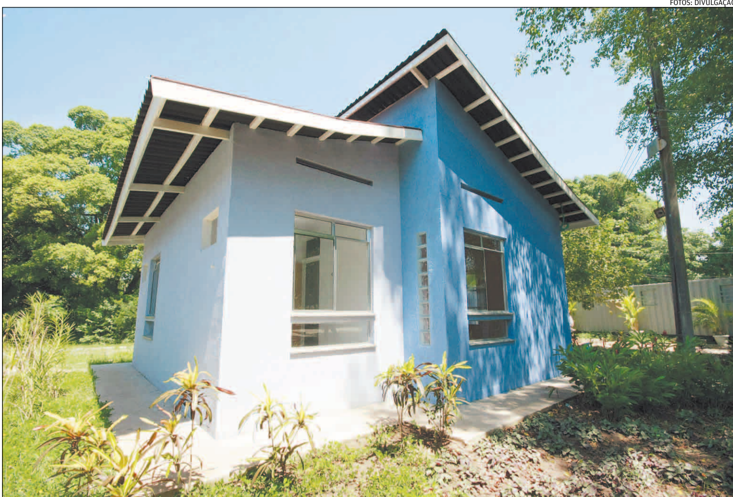
O IMÓVEL tem planta já projetada, mas a cor e os detalhes do acabamento podem ser escolhidos pelo cliente no ato da compra